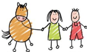
Pony Power voor Kids

Met regelmaat start er een nieuwe cursus voor kinderen van 7 t/m 9 jaar en 10 t/m 12 jaar.